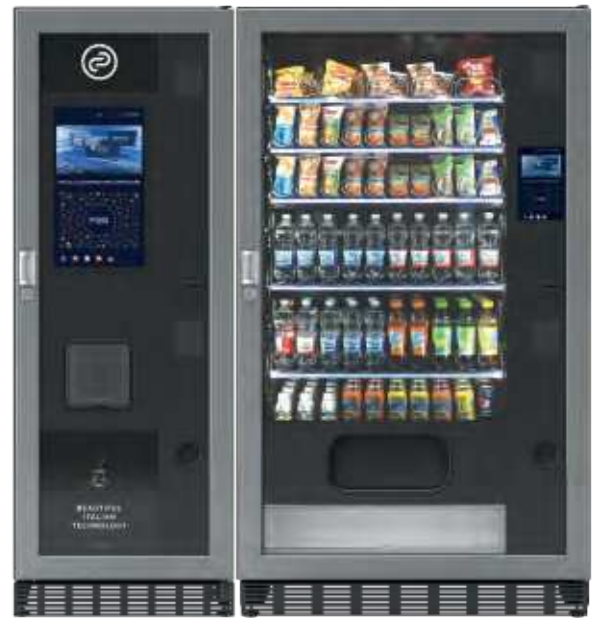
Fas Victoria + FAS 1050 Pro