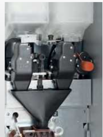
Automatische Mahlgradeinstellung in der Version Top